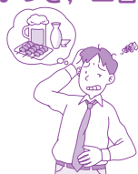
飲み過ぎ, 食べ過ぎ