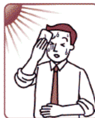
胃のもたれ、胃部不快感