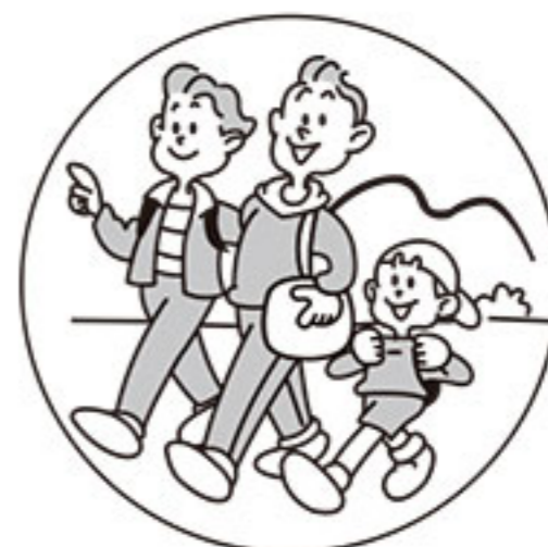
旅行など環境の変化で おなかの調子をくずしたときに