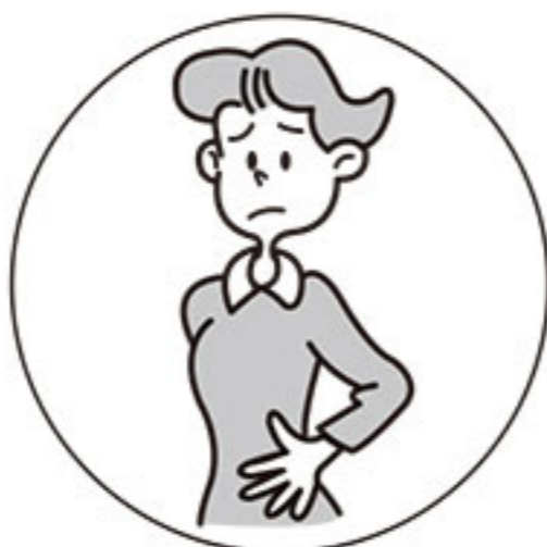
おなかが はったときに