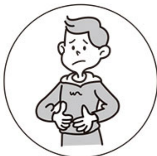
おなかの弱い方の 整腸に